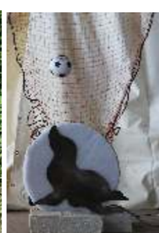
2015, de zeehond één van de moeilijkste doelen