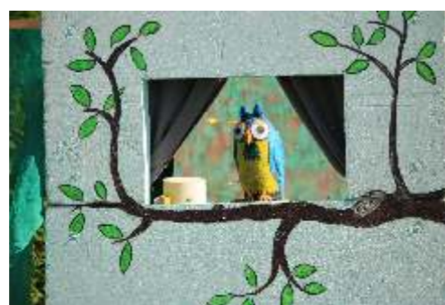
2015, Fabeltjeskrant , bewegend, in kleur en met compleet geluids verhaal Was voor de kleintjes onder ons bedoeld , maar de ouderen konden het beter smaken. "en snaveltjes toe"