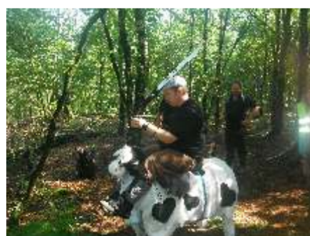
2015, bij gebrek aan paarden in Poppel, Cow-boy's doel

30 tot 34 Doelen, basis regel 1 pijl telt (+ 2 reserve pijlen indien vorige mis), 1 ronde Peletons van 5