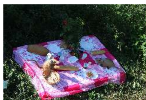
2015, Ratten Picknik